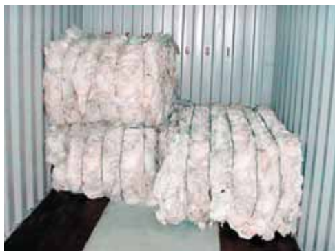
Hleðsla í gáma til útflutnings.