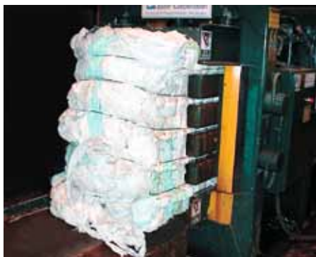
Pressun til útflutnings.

Tíðni safnana er oft ákveðin í samvinnu við sveitarfélögin og verður áhersla lögð á góða þjónustu.